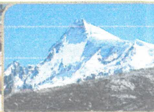
NEVADO DE PARIACACA