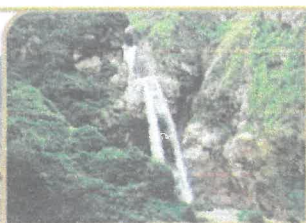
CATARATA DE ANTANKALLO