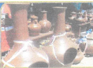
STO. DOMINGO DE LOS OLLEROS