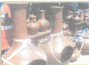
STO. DOMINGO DE LOS OLLEROS