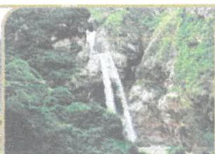
CATARATA DE ANTANKALLO